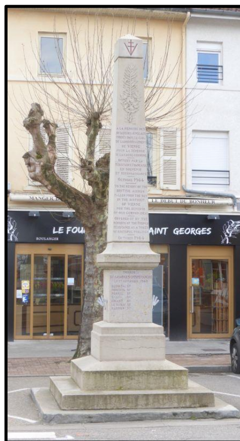
Monument aux anglais