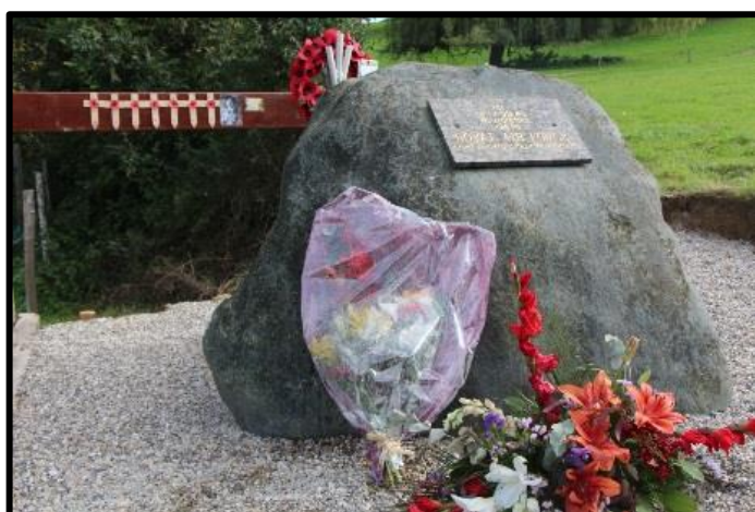
Stèle sur le lieu de chute de l'avion, réalisée en 1993 pour le cinquantième.