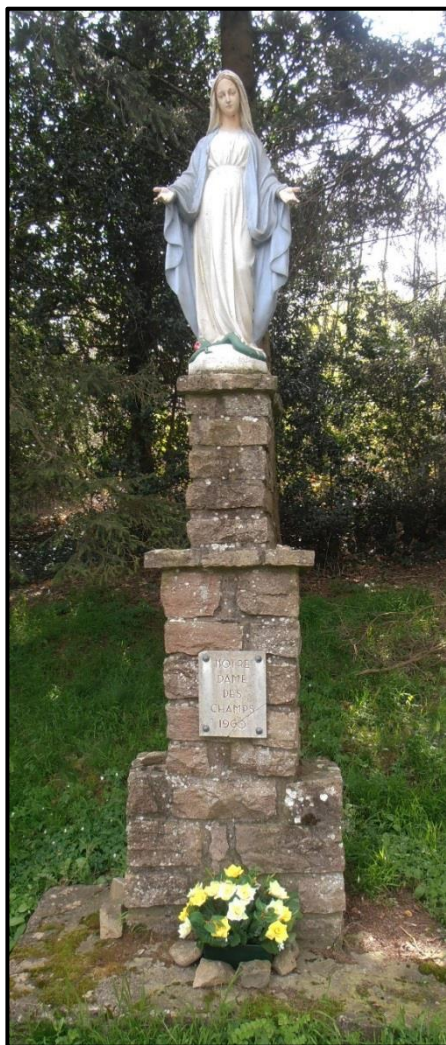
La Madone de Comberousse

Saint Georges possède de nombreuses croix sur son territoire, témoins de la ferveur du passé. Pour les hameaux du village, elles étaient le point d'accueil du défunt pour la cérémonie religieuse.