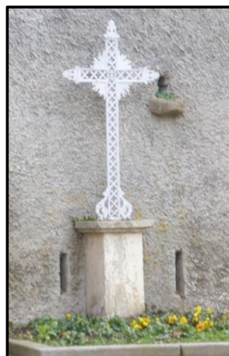
du puits Bouchard