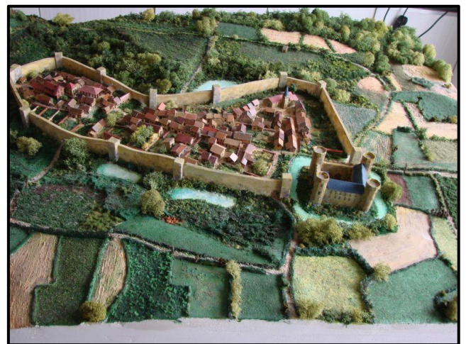
Vue perspective et maquette du village en 1300